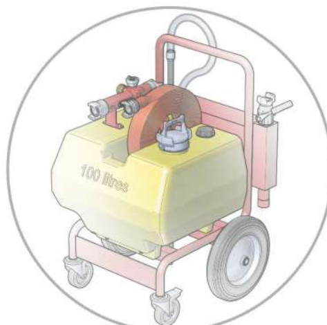
Unité mobile avec réservoir 100 litres, proportionneur "MIXY EDUCTOR" 200 ou 400 L/min et lance à mousse bas foisonnement 200 L/min