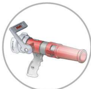
Livré avec lance à mousse bas ou moyen foisonnement de 200 ou 400 L/min